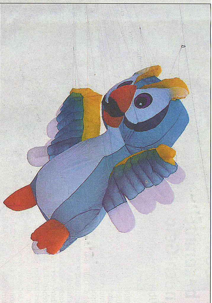
Eine übergroße Eule zog über dem Südstrand ihre Kreise. Für das Drachenfestival machte die Eule eine Ausnahme und flog auch am Tag.