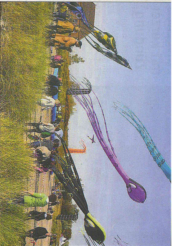
Über die Besucher hinweg flogen diese drei Kraken beim Drachenfestival. Am Südstrand konnte der Besucher sich das Spektakel anschauen.